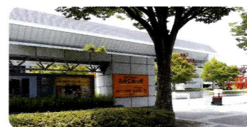
京都みやこめッセ 〒606-8343 京都市左京区岡崎成勝寺9番地の1